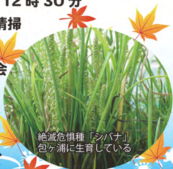
絶滅危惧種「シバナ」 包ヶ浦に生育している